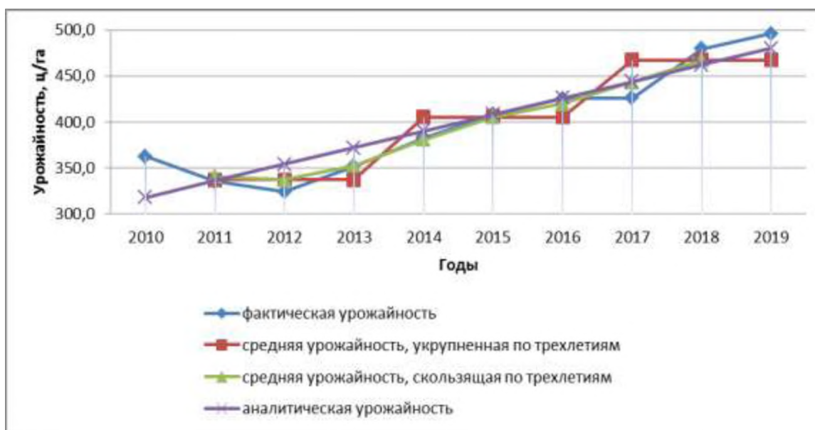
Рисунок 2 -Динамика урожайности сахарной свеклы за 2010-2019 гг.