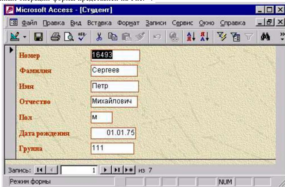
Рис. - Пример формы

На экране появится окно с выводом данных из таблицы в виде формы. Вид полученной в результате проделанных операций формы представлен на Рис. -.