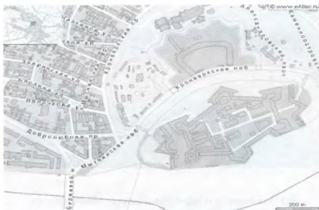
Найдем в картографической системе Google Earth ваш город и ваш район.