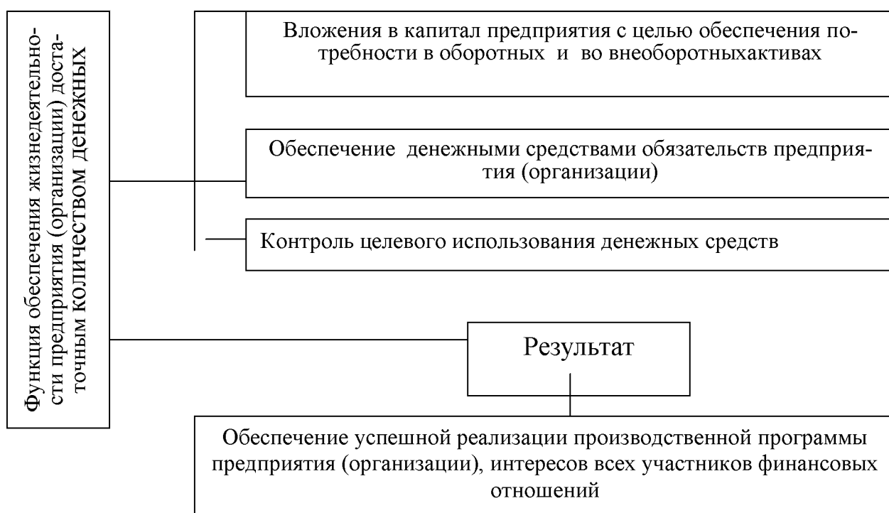
Рисунок 1. Функция обеспечения жизнедеятельности предприятия (организации) достаточным количеством денежных средств

Перечислите основные объективные и субъективные функции финансов. При характеристике функций используйте данные рисунка 1.